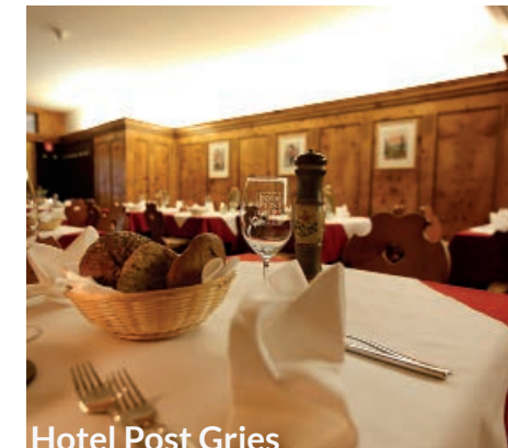
Hotel Post Gries