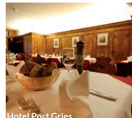
Hotel Post Gries